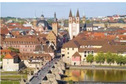
ヴュルツブルク旧市街

ゴータ 歴史は8世紀に遡り、17世紀にはザクセン=ゴータ公国の首都となり、19世紀以降ザクセン=コーブルク=ゴータ公国の首都として栄えた。18世紀にはヴォルテールが滞在し、啓蒙主義の中心地となった。1875年にはここでドイツ社会民主党が結成され、その際の綱領草案がカール・マルクスに批判されたこと(「ゴータ綱領批判」)で知られる。